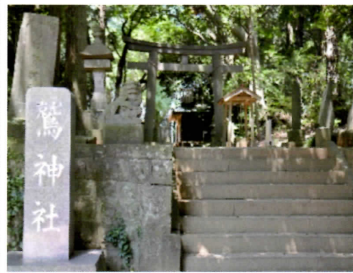
鷲神社の 本殿と鳥居